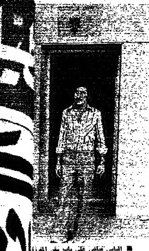
البياس تفتيش على باب مقر المفزة